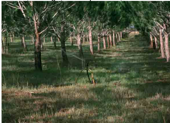
Fig. 1. Plantación de Pino piñonero micorrizado con Lactarius deliciosus en producción.

En nuestro país la truficultura es una realidad, las plantaciones artificiales de encina micorrizada con Tuber melanosporum aumentan cada año. Para este hongo la fase de producción de planta micorrizada con inóculo esporal y o miceliar ya ha sido desarrollada. Los problemas llegan en la segunda fase, su cultivo: arados, riego, temperatura, niveles