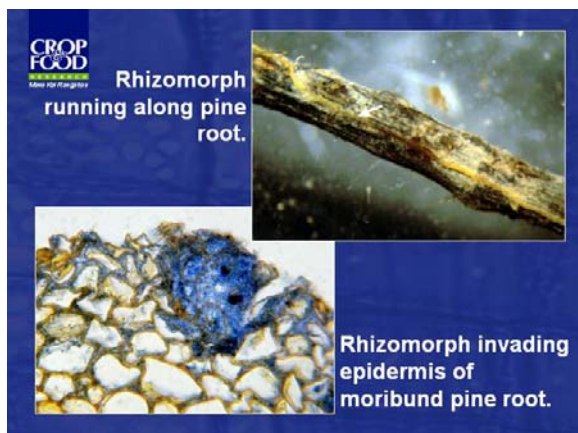
Fig. 5. Rizomorfo de Lactarius deliciosus invadiendo la epidermis radical del pino que lo hospeda. Autor: Wang Y. Crop & food Research.

El objetivo de estas reflexiones es poner en relieve algunas de las áreas sobre las que vale la pena explorar, si pretendemos llegar a cerrar con cierto éxito, el ciclo de cultivo de algunos hongos micorrícicos con los que actualmente estamos trabajando.