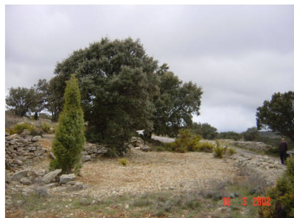
Fig. 6. Quemado producido por la presencia de Tuber melanosporum